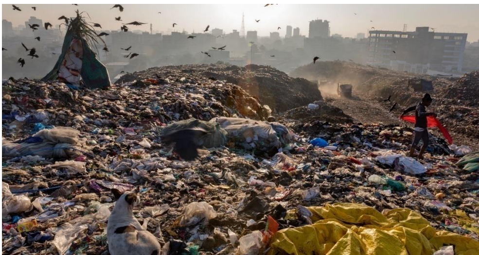
Задание № 2