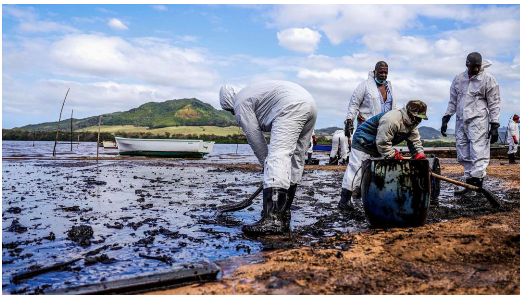
Картинка № 2

Какие экологические проблемы наиболее важны для вашего региона?